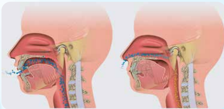
MOUTH BREATHING Lower tongue posture (Incorrect growth)